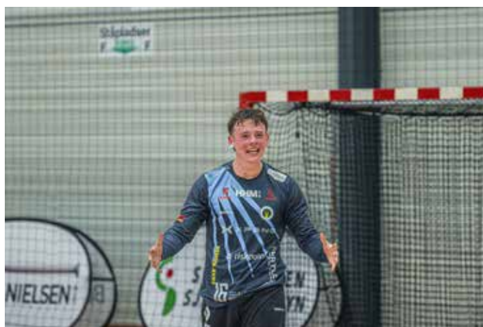
"KP" leverede ligeledes en rigtig flot kamp med en redningsprocent på 36%