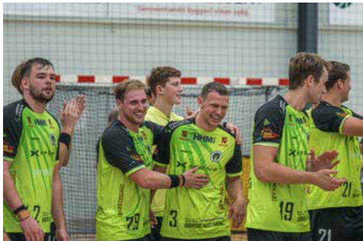
Glæde efter kampen da sejren var hjemme.