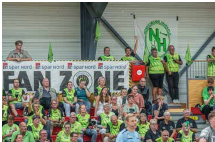
Fanzonen sørgede for at stemningen var i top, i en flot besøg Helsingør-hal.

Fredag aften i Helsingør gik planmæssigt, da oprykkerne fra Grindsted blev sendt hjem med et nederlag på 30-24. Selvom vi var bagud undervejs fik vi kæmpet os tilbage og vandt overbevisende til sidst. Sidenhen sikrede drengene sig endnu en sejr i udekampen mod Ribe-Esbjerg HH, hvilket eskalerede den i forvejen gode start på liga-sæsonen.