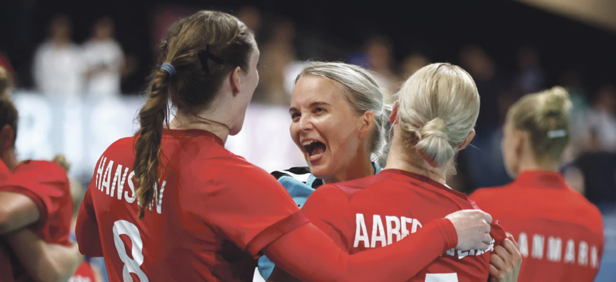
En længe ventet medalje kom med hjem til Danmark efter 20 års tørke.