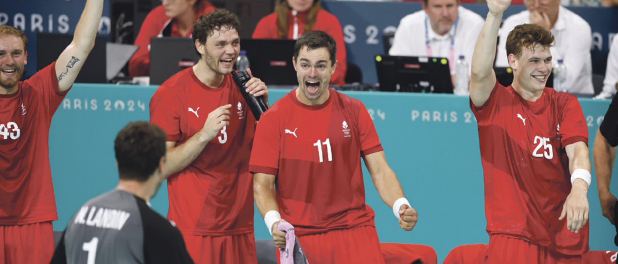
Den danske bænk hvor det er en kendsgerning, at Danmark får guldsejren over tyskerne.