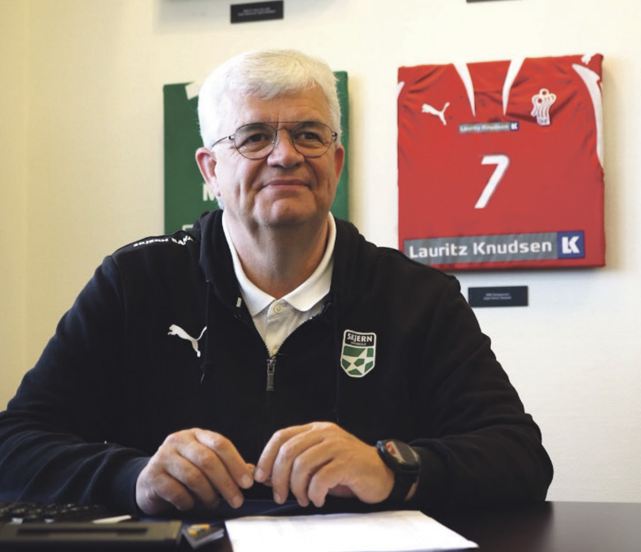
Carsten Thygesen