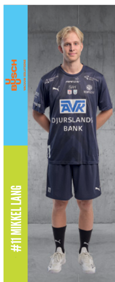
#11 MIKKEL LANG