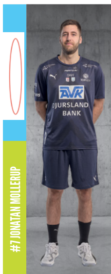
#7 JONATAN MOLLERUP